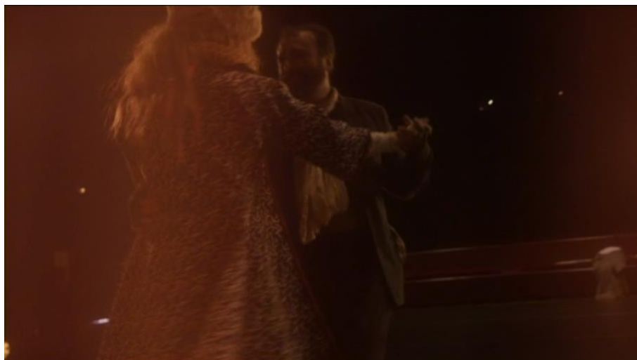
Figura 9: Imagem captada por detrás das cortinas.

No mesmo plano, vemos a atriz espiando dos bastidores por entre as cortinas. Depois, vemos um plano subjetivo como se fosse o olhar dela por entre as cortinas. Após a abertura do filme e de alguns outros planos, voltamos às imagens do teatro, e agora assistimos a tudo por trás de um véu fino que se encontra em frente à câmera, como se fosse a linha suave e tênue que separa o real da ficção.