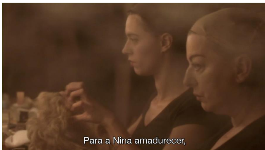
Figura 7: Imagem difusa, como se tivesse um véu na frente da lente da câmera.

O filme se inicia com Serge e outros atores em cena, ensaiando A Gaivota em cima do palco. É bonito: a câmera se inicia afastada, aproximando-se timidamente até estar bem perto dos atores, como se estivesse adentrando este mundo. Seguimos com outro plano dos atores, e então temos o terceiro plano filmado bem próximo às cortinas do teatro, na parte de trás do palco. Vemos Olivia abrindo uma brecha nas cortinas e deixando as atrizes passarem dos bastidores à cena.