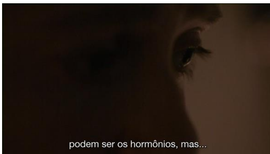
Figura 6: Exemplo de plano bem próximo à Olivia.

Acompanhamos Olivia durante todo o filme, chegando bem próximas a ela em recorrentes planos fechados, que nos mostram os detalhes de seus dias. Há também muitos planos próximos a seu rosto potencializando suas expressões e sentimentos. A câmera vem, portanto, como uma confidente íntima que deseja chegar o mais próximo possível da subjetividade daquela mulher. Os planos extremamente próximos revelam, de forma quase física, esse desejo da câmera de aproximação, como se a lente fosse capaz de captar algo que nos escapa aos olhos distantes. O filme é uma explosão de intimidade.