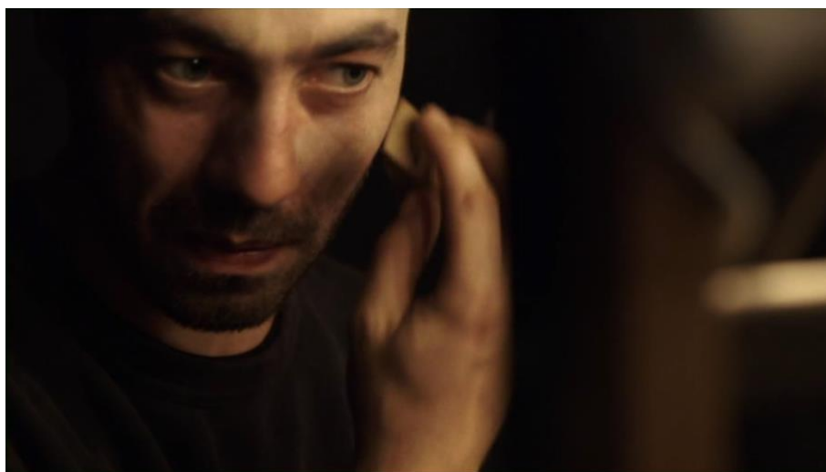
Figura 10: Ator se maquiando.

Há ainda no início, as cenas das atrizes e atores se maquiando no camarim, ato que também remete à ideia de processo e se caracteriza como o abrir das cortinas e o passar de um lado para o outro , levando ainda resquícios e emoções descobertas no outro lado. O maquiar-se acontece enquanto potência, como escolha de ficção: é um ato no qual eu escolho experimentar e vivenciar algo que é distinto do que sou, um disfarce que me abre para outro universo, outra vivência.