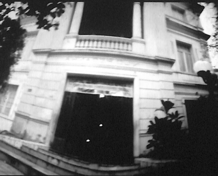
Colégio Estadual Nilo Peçanha