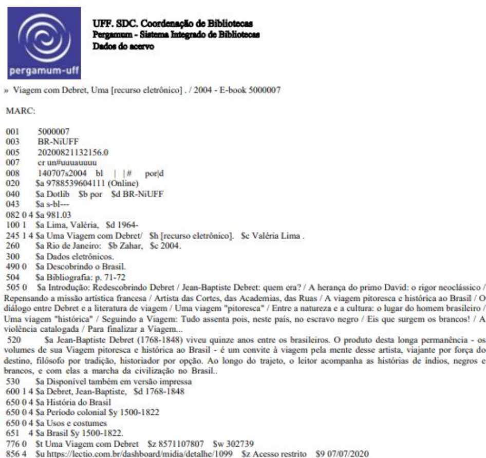
Figura 6 – Visualização no catálogo eletrônico